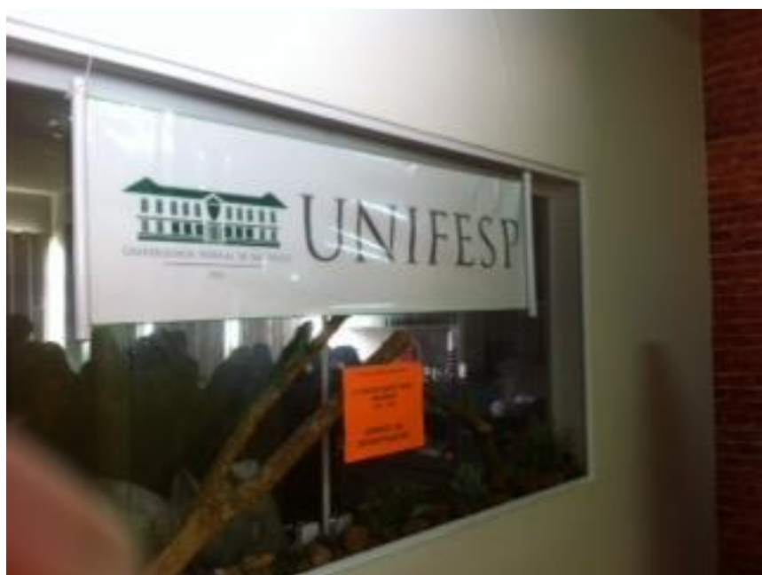
Estande da UNIFESP no laboratório da Escola Stagium