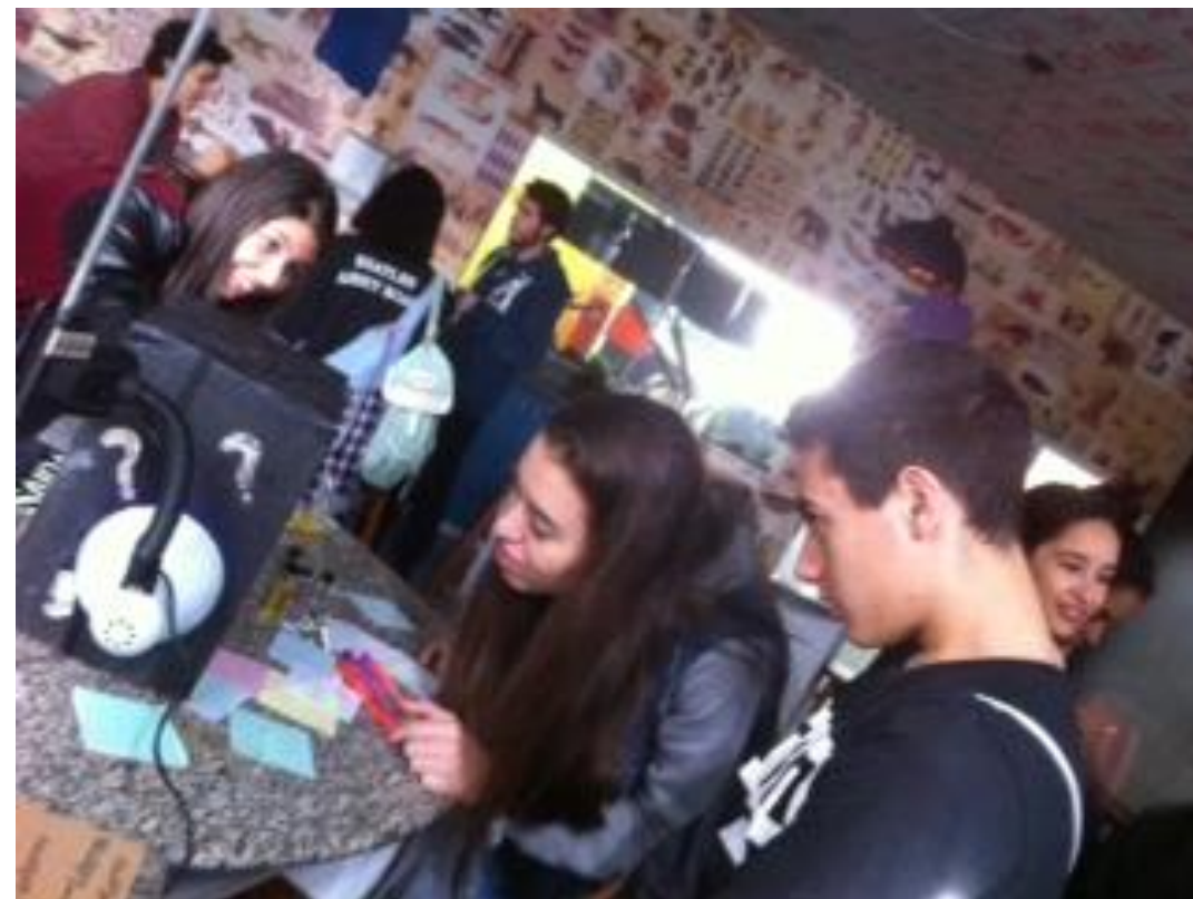
Estudantes & Caixa Mágica