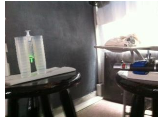
Lente d' água