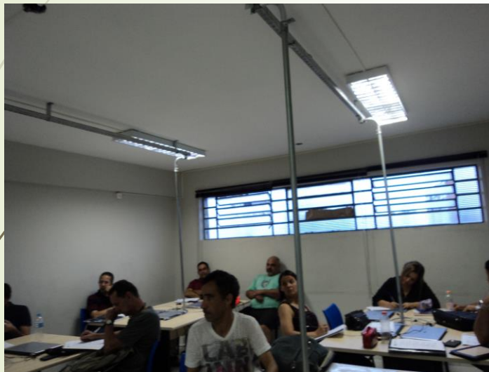
Formação Continuada Programa de Formação continuada de Professores de Ciências e Matemática- 2. edição - 2015 - 2016 - http://gefop.unifesp.br

Contribuir com a construção de uma Cultura de Formação de Educadores da e para a Escola Básica no Campus de Diadema, promovendo o desenvolvimento da formação inicial e continuada de educadores da escola básica em suas dimensões filosóficas, educacionais, culturais, sociais e profissionais por meio de metodologias educacionais/pesquisas que abranjam o ensino, a extensão e a pesquisa, em conformidade com as políticas educacionais da UNIFESP.