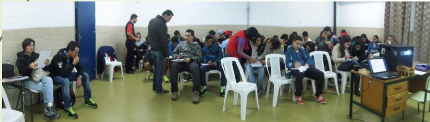
Momentos de ensino, pesquisa e extensão