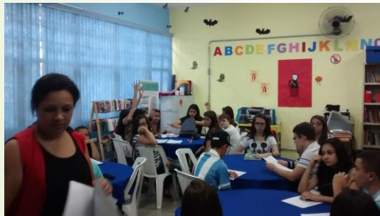
Projetos Institucionais Momentos da formação inicial

► A metodologia das ações a serem realizadas é o próprio reconhecimento do profissional e a sua valorização, dando voz aos educadores em formação e considerando suas práticas profissionais e experiências de vida como ponto de partida, marcando o seu papel de sujeito autônomo em um processo de ensino e aprendizagem dialógico, crítico, reflexivo e científico.