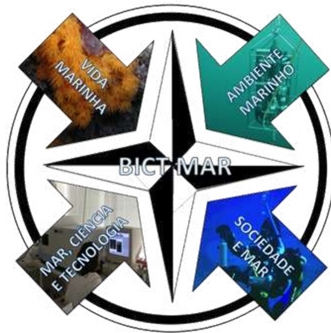
Figura 2. Distribuição dos eixos direcionadores que compõem o BICT Mar.