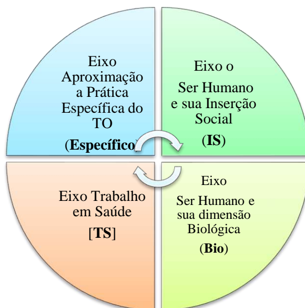
Figura 1. Eixos de formação que perpassam os anos dos cursos de graduação do Instituto Saúde e Sociedade do Campus Baixada Santista, Unifesp.

Abaixo apresenta-se a organização curricular geral, com a distribuição das cargas horárias segundo as categorias que compõem a matriz curricular: unidades curriculares (UC) fixas, unidades curriculares eletivas, Estágio Curricular Profissionalizante, o Trabalho de Conclusão do Curso e Atividades Complementares da Graduação.