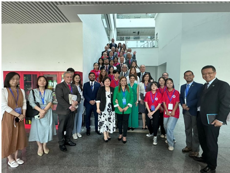
01/07/23 Hebei Normal University - Visita ao Departamento de Estudos Brasileiros e ao Centro de Estudos Peruano