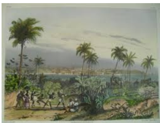
Figura 02 - Gravura de Johann Moritz Rugendas intitulada San-Salvador.