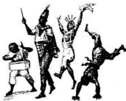
Figura 04 – Negros Volteadores (Debret – 1824)