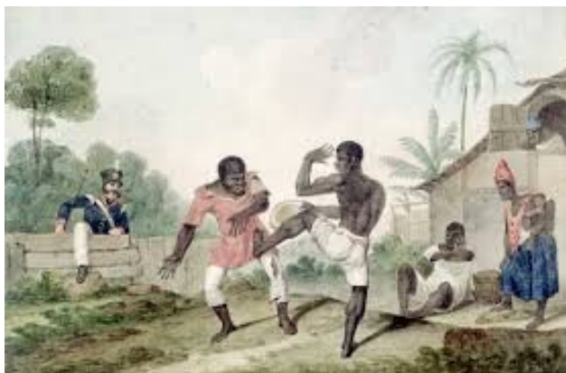
Figura 01 - Os negros lutando na aquarela de Augustus Earle capoeira - Danse de la guerre, (1835)

Em nossos dias, a capoeira, se tornou muito popular, mas o preconceito contra a cultura afro-brasileira ainda persiste.