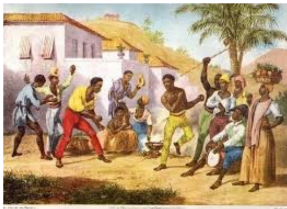
Figura 03 - Óleo sobre tela de Johann Moritz Rugendas intitulada Jogar