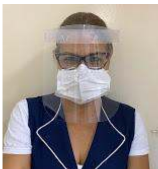
face shild 3.jpg 117K