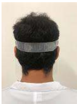
mascara 4.jpg 71K