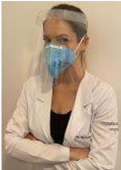
face shild.jpg 97K