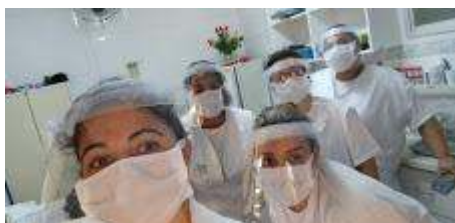
face shild 4.jpg 64K