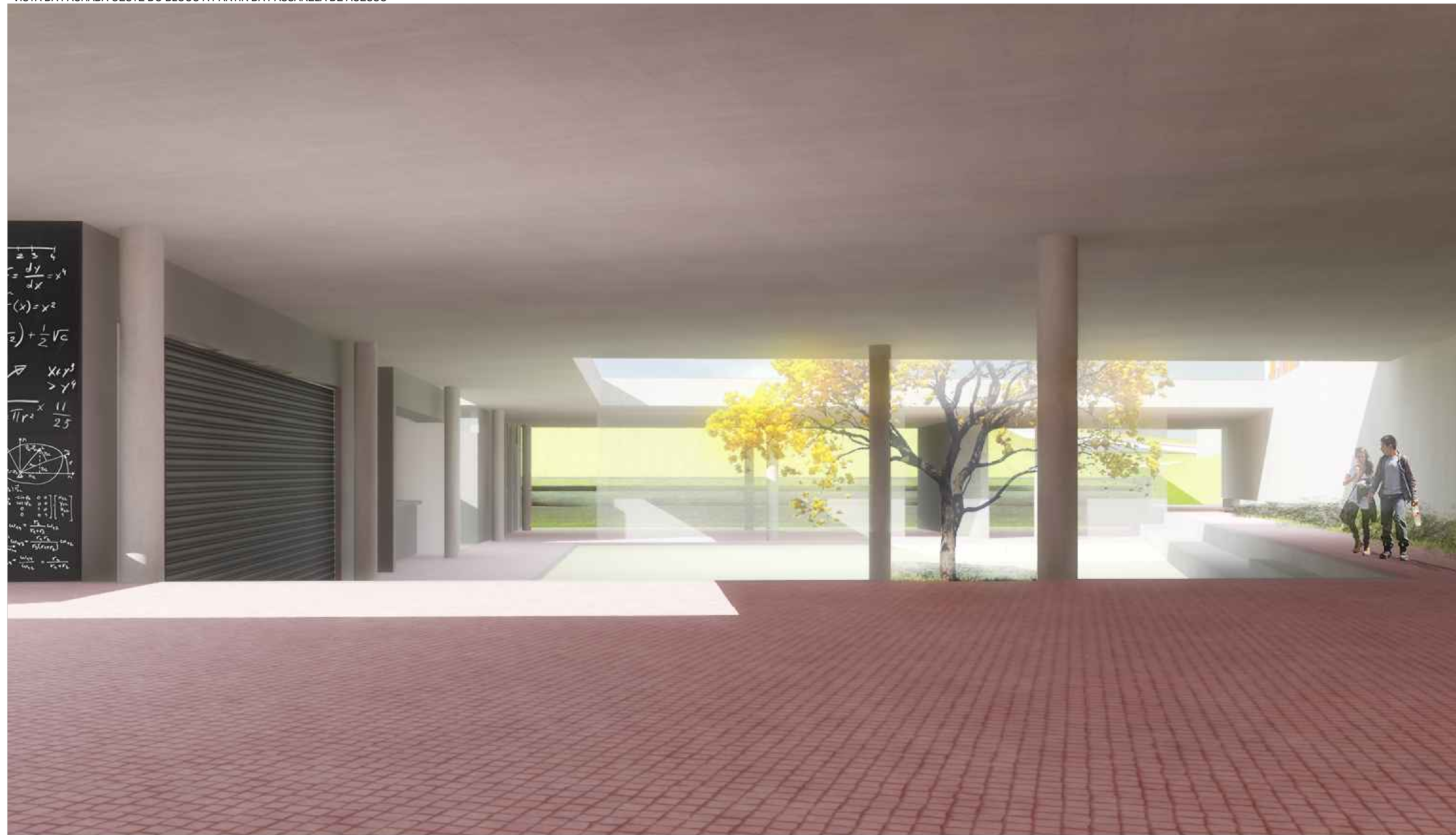
IMAGEM 06 VISTA GERAL DA ÁREA COMUM CENTRAL A PARTIR DA ACADEMIA/SALA DE JOGOS