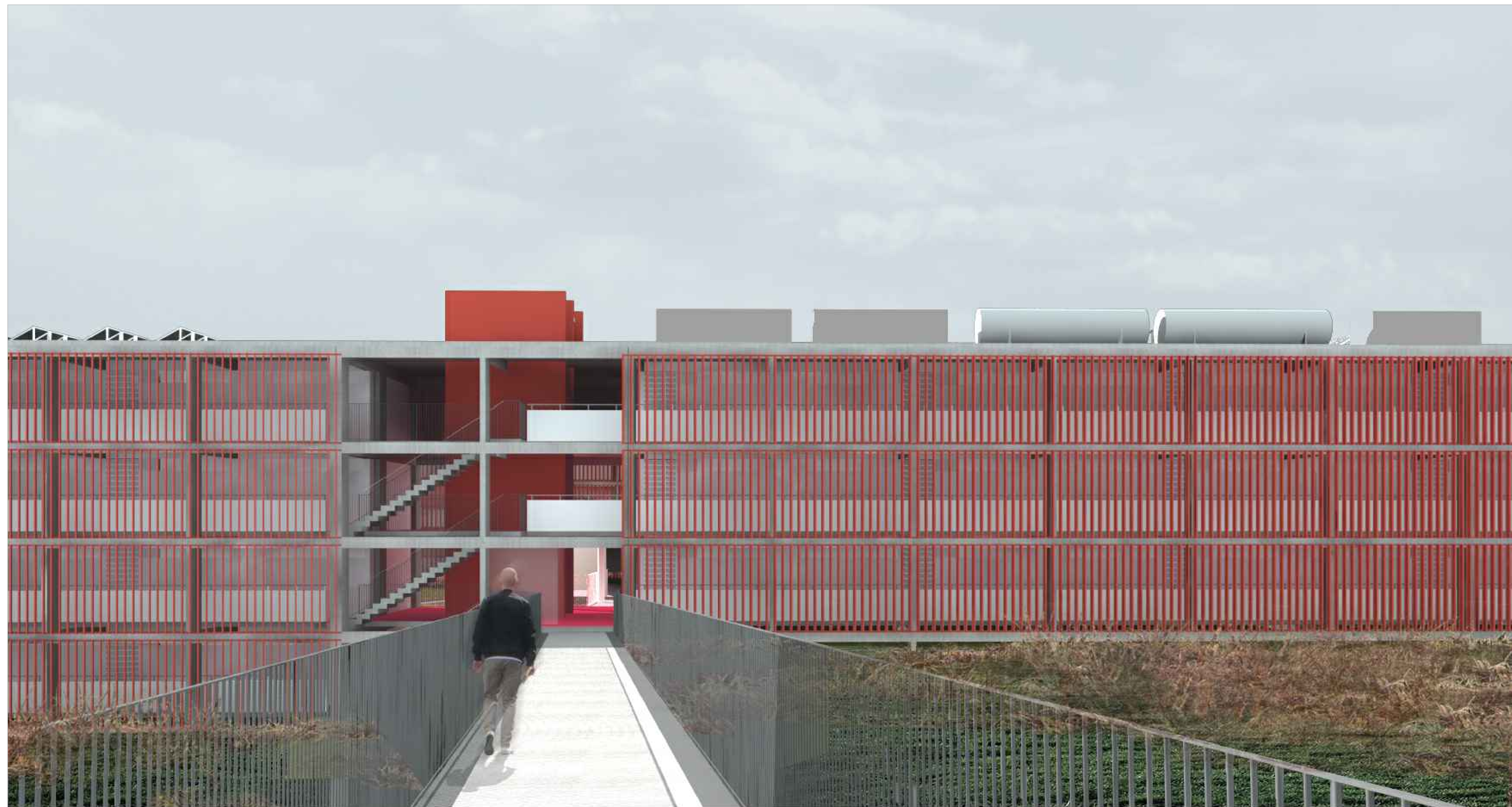
IMAGEM 04 VISTA DA FACHADA OESTE DO BLOCO A PARTIR DA PASSARELA DE ACESSO