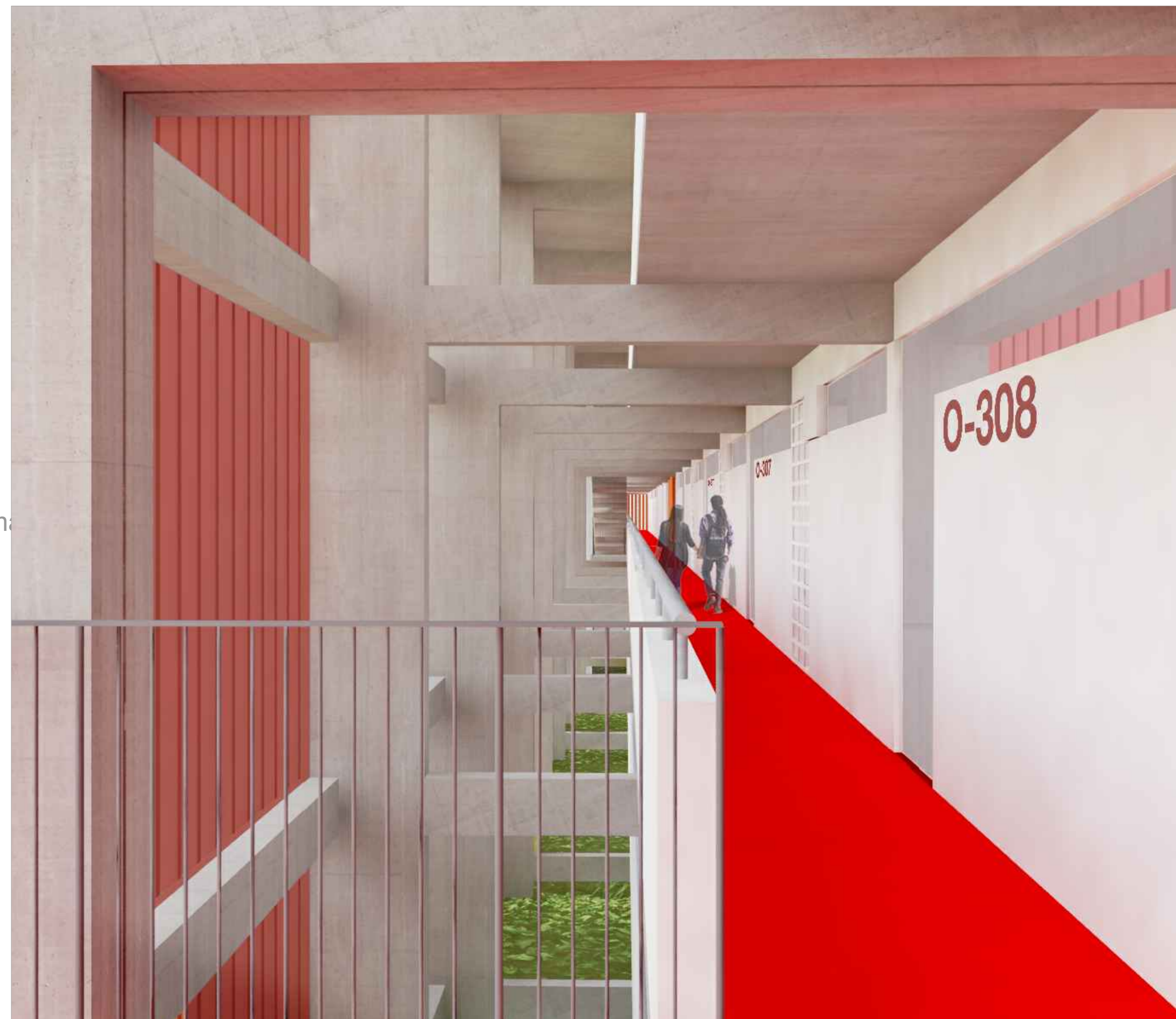
IMAGEM 05 VISTA DO CORREDOR DE ACESSO AOS APARTAMENTOS