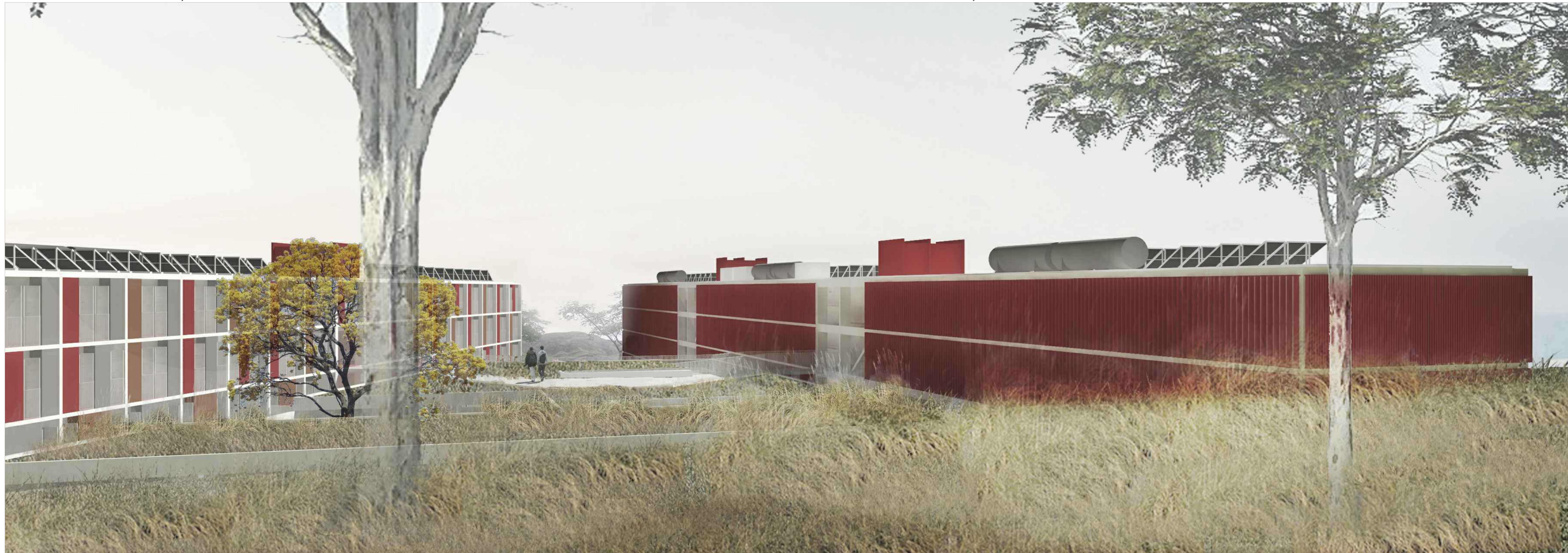
IMAGEM 01 VISTA GERAL DO CONJUNTO A PARTIR DO ESTACIONAMENTO