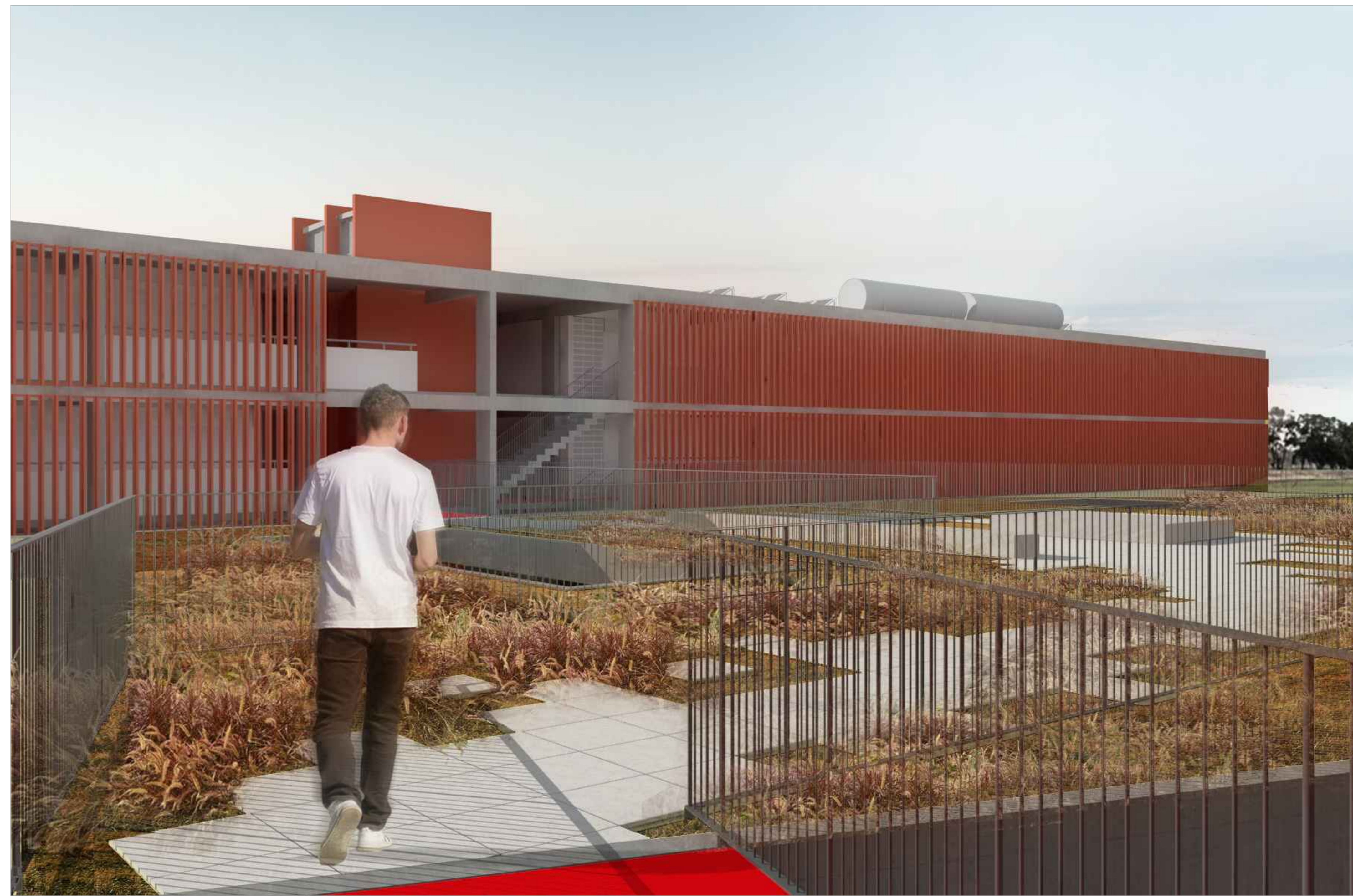
IMAGEM 03 VISTA DA FACHADA OESTE DOS BLOCOS DE HABITAÇÃO A PARTIR DA LAJE CENTRAL