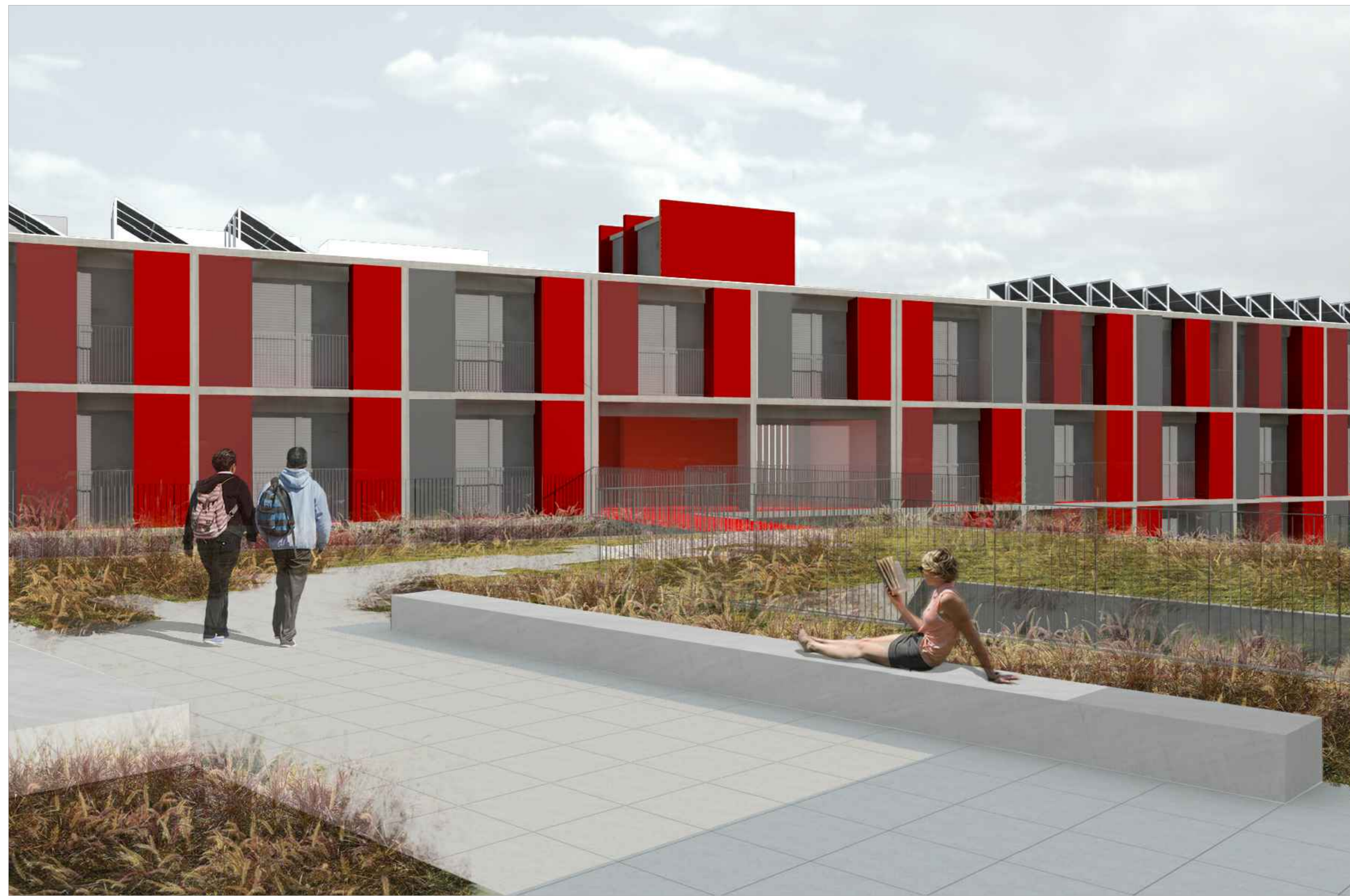
IMAGEM 02 VISTA DA FACHADA LESTE DOS BLOCOS DE HABITAÇÃO A PARTIR DA LAJE CENTRAL