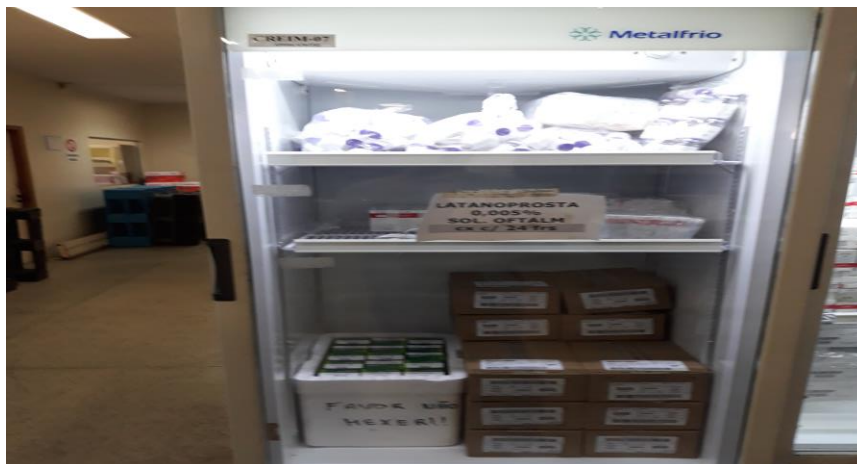
Geladeira sem portas de vidro, o que dificulta a percepção da falta de medicamentos