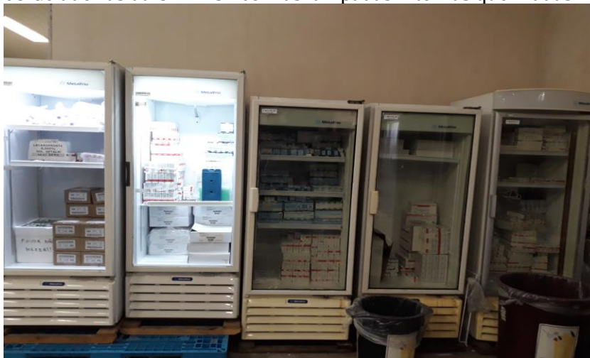
03 Geladeiras da UNIFESP com as lâmpadas internas queimadas

Achado de Auditoria 04 – Identificou-se a existência de 13 geladeiras no almoxarifado, todas sem trava ou cadeado de segurança, sendo que 3 geladeiras são de propriedade da UNIFESP (as três estão com as lâmpadas internas queimadas) e 10 geladeiras pertencem a SPDM, sendo que 2 estão sem utilização, conforme demonstrado nas figuras a seguir: